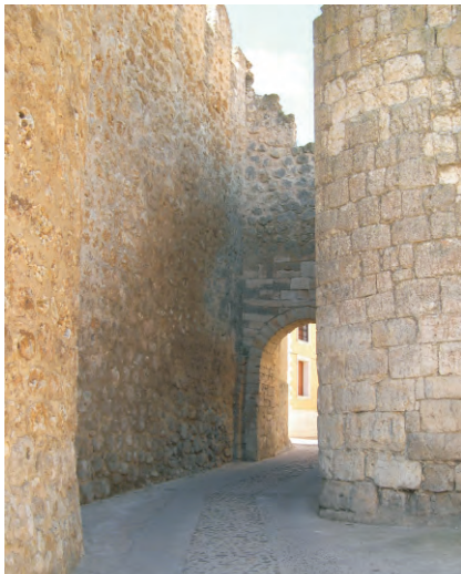
Puerta Norte de entrada a Urueña

Se encuentra en el borde de los Montes Torozos, comarca natural de Valladolid, refugio del jabalí y el lobo, en la que alternan las planicies del páramo de encina y quejigo con los valles de pequeños ríos.