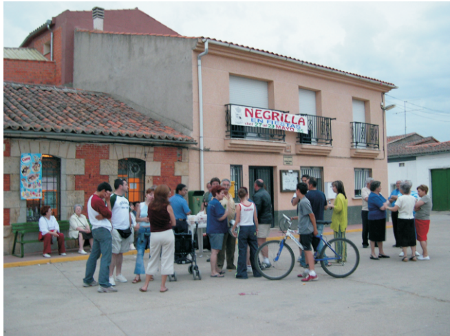
El Sábado por la tarde nos reunimos en la plaza para merendar unas pancetitas la brasa.