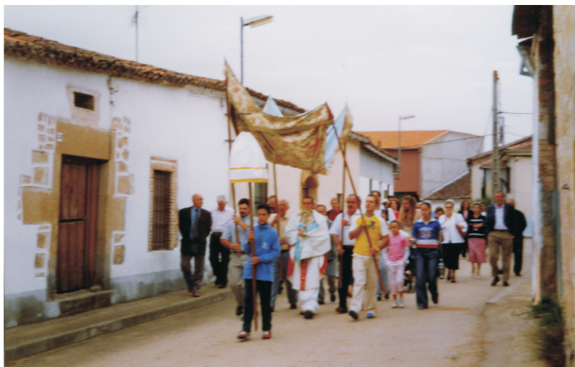
Procesión por las calles del pueblo.